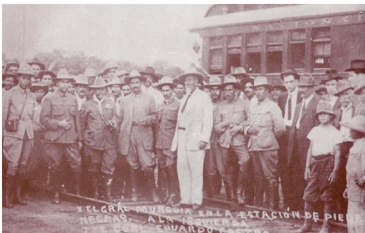
El general Murguía, con cigarrillo en su mano izquierda, es rodeado por miembros de su tropa en la estación ferroviaria de Piedras Negras, Coahuila.