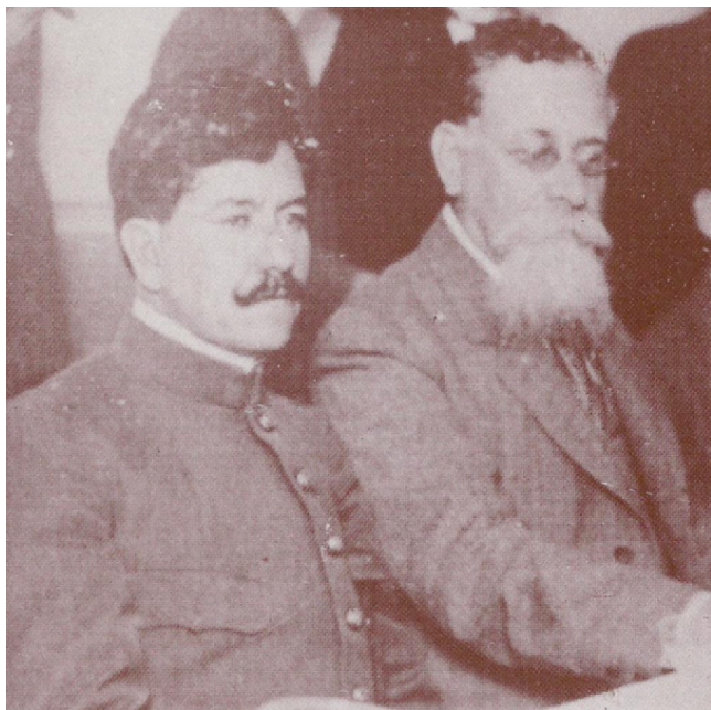
Carranza y Murguía en el último banquete que se sirvió en la casa presidencial. En menos de un mes, don Venustiano sería asesinado en las sierras de Puebla.