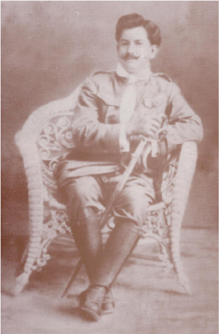
El revolucionario Francisco Murguía posa en su estudio, Sabinas, Coahuila.