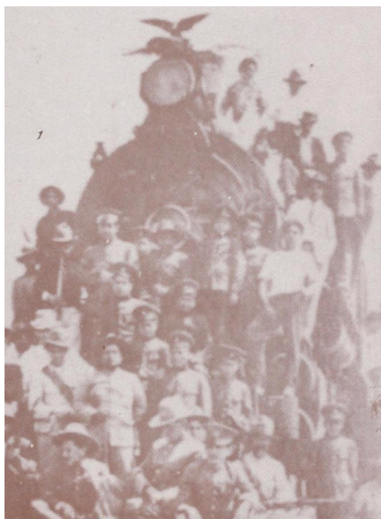
La famosa máquina "La Leona", que el general Murguía obtuvo en la épica batalla de León, Guanajuato, cuando derrotó al ejército villista.

El Héroe de León, como se le llamó, posa con su tropa.