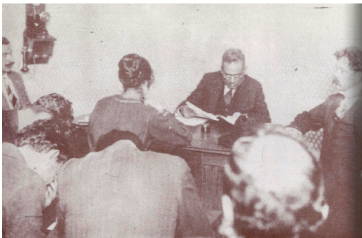
Durante el juicio que se siguió al general Murguía, el careo con el traidor Rodolfo Herrero acaparó la atención nacional.