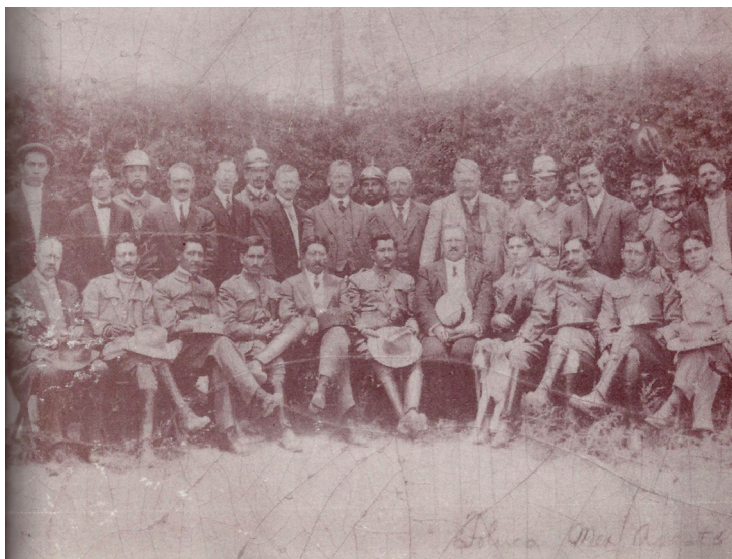
Luego de ser derrocado el usurpador Victoriano Huerta, el general Francisco Murguía fue designado por el Primer Jefe del Ejército Constitucionalista, don Venustiano Carranza, como jefe militar y gobernador del Estado de México.