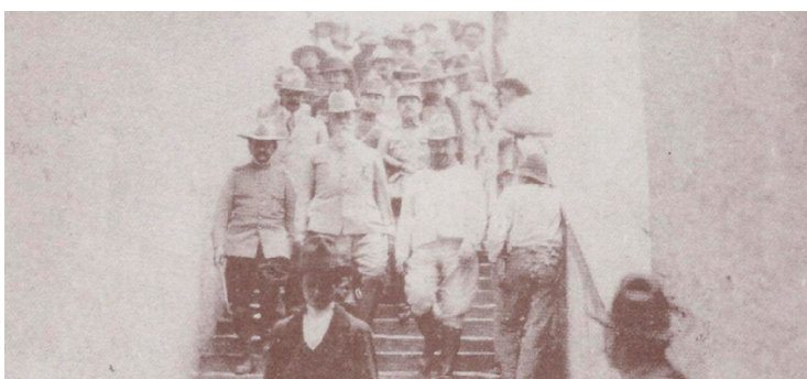
Con un puñado de seguidores, entre los que se encontraba el general Murguía, el presidente Carranza enfila rumbo al sacrificio. De la ciudad de México salió rumbo a Veracruz, pero encontró la muerte en Tlaxcalantongo, en ese mayo de 1920.