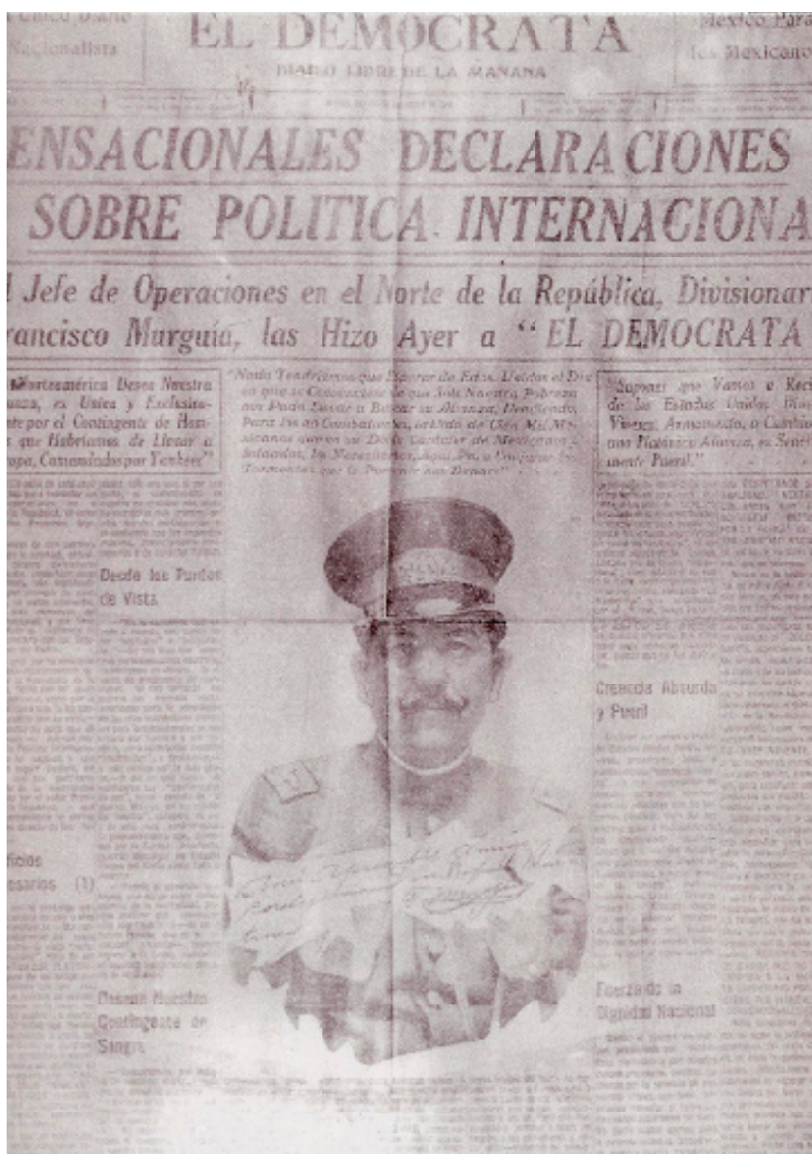
Primera plana del periódico El Demócrata, publicada el 30 de octubre de 1917, cuando el general Murguía hizo pública su opinión sobre el intervencionismo extranjero en nuestro país.