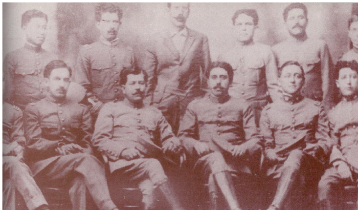
Como jefe de la Segunda División del Noreste, el recién ascendido a general, Francisco Murguía, posa con los miembros de su Estado Mayor.