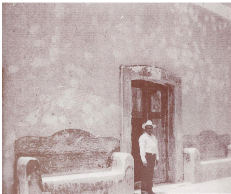
En esta finca de la hacienda de Majoma, en el minero estado de Zacatecas, nació el 4 de marzo de 1876 el que sería uno de los más leales revolucionarios del carrancismo, Francisco Murguía López de Lara.