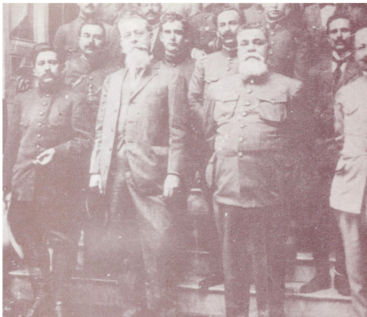
El Primer Jefe del Ejército Constitucionalista, don Venustiano Carranza, con generales de su confianza: Francisco Murguía, Jesús Carranza y el doctor José María Rodríguez.