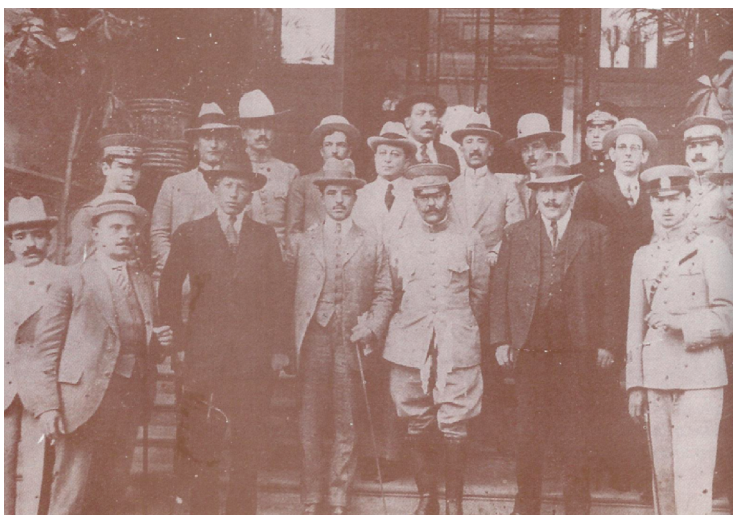
Los sobrevivientes del carrancismo le ofrecieron un banquete al general zacatecano, luego de ser liberados.